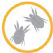
ヤケヒョウヒダニ